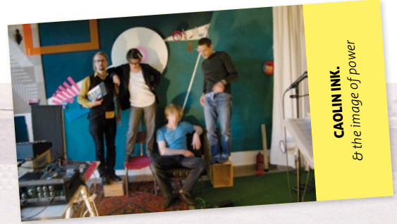
CAOLIN INK. & the image of power